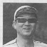
河野俊剛知事 (フルマラソン)