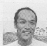
東国原英夫知事 (ハーフ)