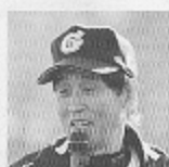
萩本 欽一さん (5キロ)

往年の名ランナー、話題の県知事をはじめ多彩なゲストの皆さんが参加されます。ゲストとのふれあいも楽しみです。尚、萩本欽一さんは10キロから5キロに変更になりました。10キロと5キロはコースが重なっていることや萩本さんはゆっくり走られますのでコース上での出会いのチャンスをお楽しみに!